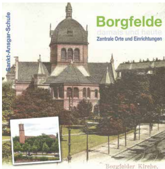
Titelbild des neuen Buches „Borgfelde damals und heute – Zentrale Orte und Einrichtungen“.

Wie schon bei den bisherigen drei Büchern wurde die ursprüngliche Ausdehnung von Borgfelde bis zur Lübecker Straße zugrunde gelegt, die bis 1894 bestand. Die beiden behandelten Einrichtungen in der Angerstraße gehören heute zum Stadtteil Hohenfelde. Obwohl das alte Borgfelde durch die Bombenangriffe 1943 weitestgehend untergegangen ist, gibt es immer noch eine ganze Reihe historische Orte oder Spuren davon zu entdecken.