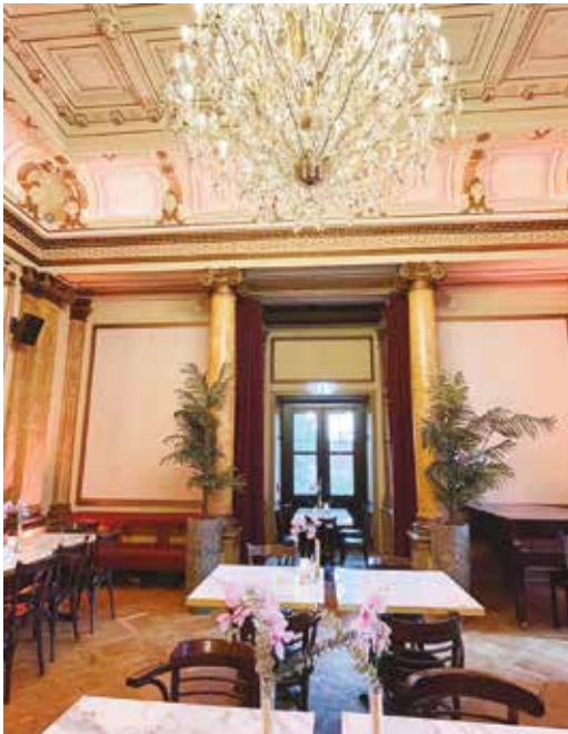
Der Eddy-Lübbert-Saal beeindruckt mit stuckverzierten Decken und Kronleuchtern.

Beim Spaziergang entlang der Außenalster weist auf Höhe der Alsterperle ein kleines Schild auf eine große Institution hin: Unser Literaturhaus. Zwischen 50er Jahre Fassade auf der einen und repräsentativen Außenfassaden auf der anderen Seite strahlt die klassizistische Villa in weißem Gewand. Der leuchtende Schriftzug lädt, zusammen mit der gläsernen Buchvitrine, zum Verweilen ein. Das Haus selbst hat eine vielseitige Geschichte: Gebaut in den 1860er Jahren erfolgte ca. 25 Jahre später der Anbau des heutigen Eddy-Lübbert-Saals, konzipiert als Musizier- und Festsaal durch den damaligen Eigentümer.