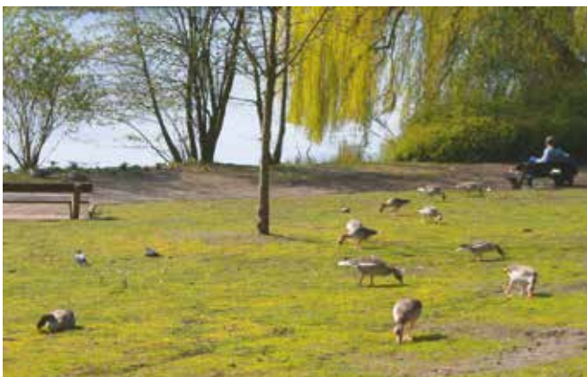
Graugänse auf der Alsterwiese Schwanenwik.

Flora & Fauna/Menschen trennen: Durch Selbstansaat ist Wildwuchs (Holunder, Brombeerranken, Horizontaltriebe aus Robinienwurzeln oder Essigbaum/Hirschkolben-sumach, Hopfen, Efeu, Gartengeisblatt usw.) entstanden, der, wie weiter oben beschrieben, an bestimmten Stellen landschaftsarchitektonisch Menschen stört und entfernt werden sollte. An bestimmten Stellen am Kuhmühlenteich und am Kanal können diese Zonen gern so bleiben