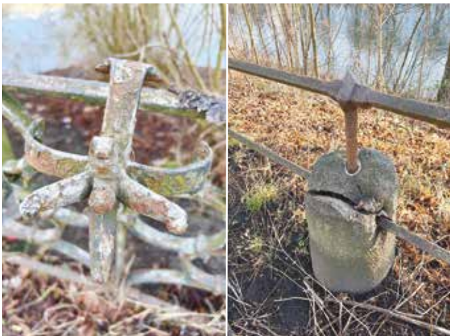
Schäden am Jugendstil-Zaun an der Armgartstraße.

Wir drücken die Daumen dafür, dass der Zaun zukünftig nicht weiter verfallen muss und man sich professionell um den Erhalt kümmert. Die bisherigen Einwendungen des Bezirksamtes dahingehend, dass der Zaun nicht akut gefährdet sei, sind unseres Erachtens nach falsch. Die Fotos beweisen das Gegenteil, oder?