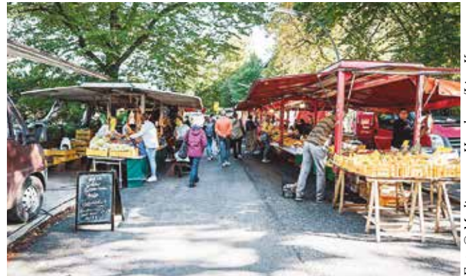
Wochenmarkt am Goldbekufer.

Mal wieder Wochenmarkt? Überall in der Stadt gibt es immer mehr Lücken in den Ständen auf den traditionellen Wochenmärkten. Dabei ist es doch so schön, frisches Obst und Gemüse, Blumen, Fleisch, Käse und andere Spezialitäten ganz entspannt an den Marktständen zu kaufen. Also, geht mal wieder zum Wochenmarkt und unterstützt die dortigen Händler.