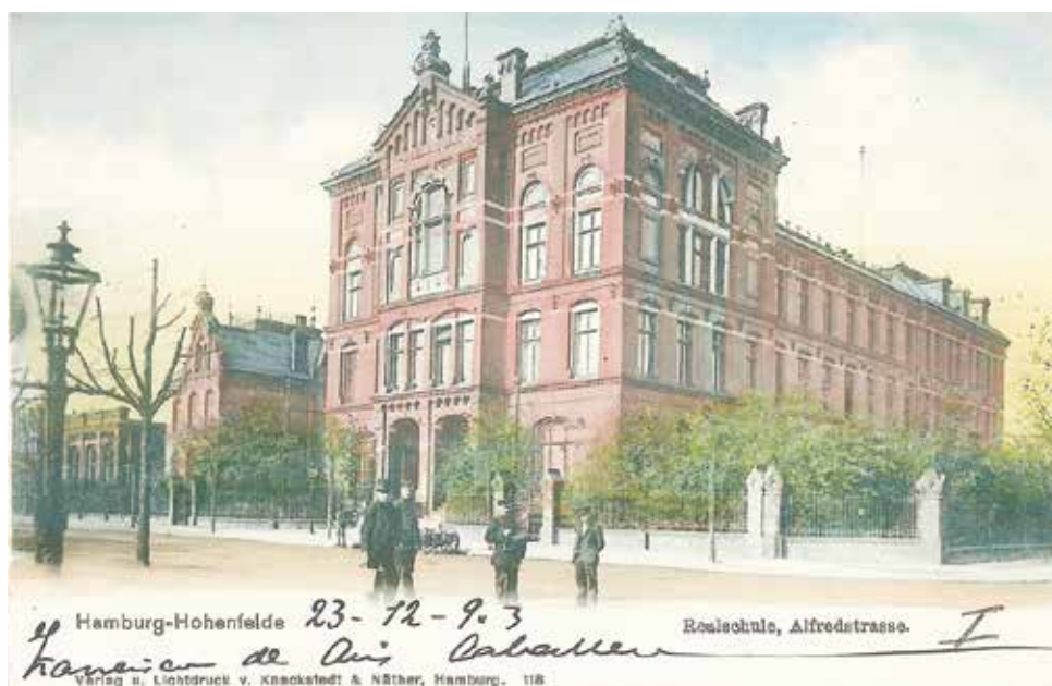
Dieses prächtige Schulgebäude stand bis 1943 an der Angerstraße/Ecke Alfredstraße.

Der farbige Bildband mit 110 Seiten und rund 100 Abbildungen kostet 10 Euro. Das Buch kann im Sekretariat der Schule (Bürgerweide 33, Telefon 251 73 410) oder in der Haspa-Filiale an der Lübecker Straße 139 erworben werden. Wenige Restexemplare des dritten Borgfelde-Buches „Unbekanntes Borgfelde“ sind in der Schule noch erhältlich, die ersten beiden Bände sind vollständig vergriffen.