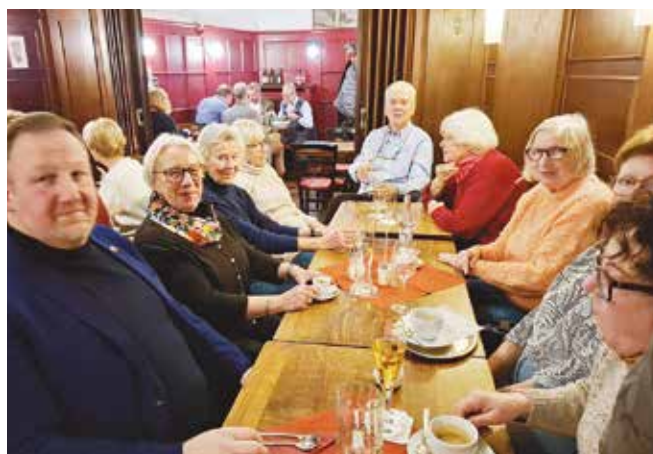
Im Restaurant Laufauf haben sich alle Teilnehmenden auf Anhieb wohl gefühlt.

Traditionsreiche Gerichte (Labskaus, Matjes, Pannfisch etc.) werden angeboten und natürlich auch Grünkohl mit allem, was dazu gehört. Sogar mit Pinkel. „Ganz wat besünneres!“ Ganz zu schweigen vom netten und aufmerksamen Kellner, der dieses Mittagessen zu einem rundum gelungenen Beisammensein machte. Wir kommen wieder! (Text & Fotos: Uschi Pfündner)