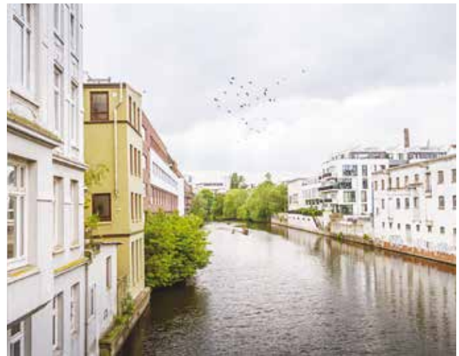
Ein Blick auf den Osterbekkanal.

(O) Osterbekkanal: Uhlenhorst war früher eine sumpfige Wiesenlandschaft, zu deren Entwässerung man Hofwegkanal, Uhlenhorster Kanal und eben auch Teile des Osterbekkanals aushob. Der Aushub wurde auf das umliegende Gelände verteilt, das dadurch erhöht wurde. Nach dem Großen Brand 1842 wurde der Alsterpegel dann auch noch um ein paar Meter abgesenkt. So konnte das Gelände parzelliert und bebaut werden.