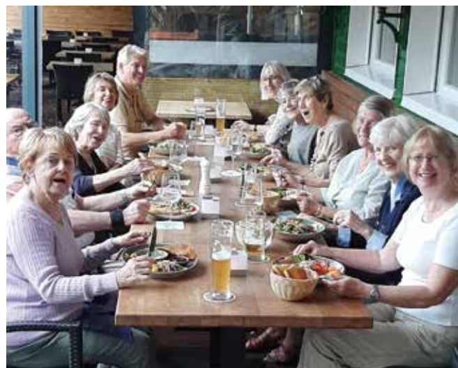
(Text & Fotos: Uschi Pfündner)