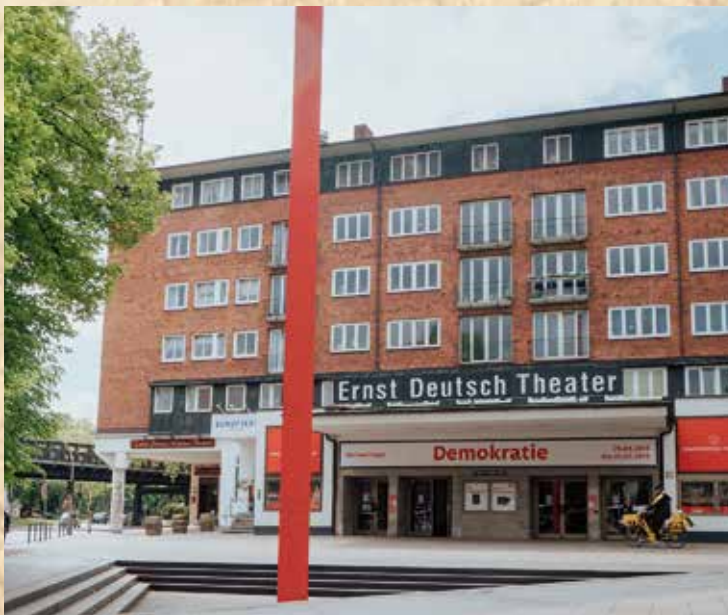
Ernst Deutsch Theater im ehemaligen Ufa-Haus. 9

Der Bau der für sportliche Wettkämpfe konzipierten Alsterschwimmhalle begann 1968 und dauerte fünf Jahre. Die einmalige Dachschaalenkonstruktion hat eine Spannweite von 96 Metern und wird wegen ihres eleganten Anblicks als Schmetterling bezeichnet. Bei der aktuellen Sanierung blieb dieser Gebäudeteil vollständig erhalten. Übrigens waren ungeplante Kostensteigerungen bei öffentlichen Bauten auch damals schon Tradition. So verschlang der Bau der Alsterschwimmhalle letztlich 33 statt der veranschlagten 24 Millionen D-Mark. Ebenfalls kurios erscheint die Tatsache, dass das Schwimmbecken bei Eröffnung einige Zentimeter zu kurz war. So konnten Sportwettbewerbe hier erst nach einem nachträglichen Umbau stattfinden. 12