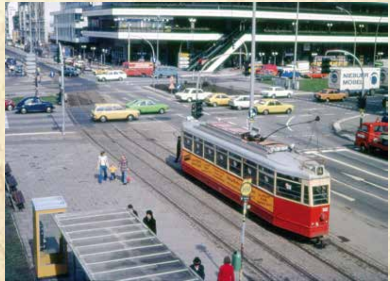
Straßenbahn an der Mundsburg. Im Hintergrund das Mundsburg Center. 11

nung befindliche Einkaufszentrum im südlichen Bereich um ein Ensemble aus drei Büro-, Wohn- und Geschäftsgebäude zu erweitern. Die ersten beiden Hochhäuser