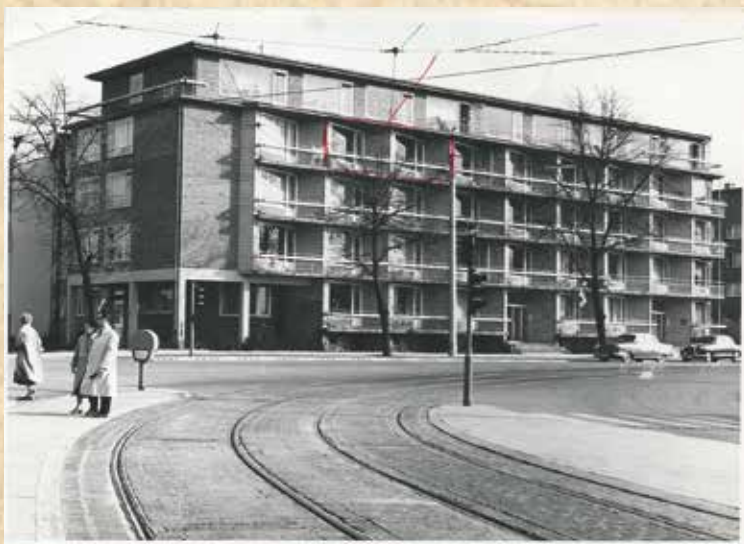
Haus Schwanenbucht in der Barcastraße. Im Vordergrund die Schienen der damaligen Straßenbahn. 4

In den 1950er Jahren begann der breit angelegte Wiederaufbau der Wohn- und Geschäftsgebäude sowie der Verkehrsinfrastruktur in unseren Stadtteilen. Die Architektur ist fortan skulptural und durch verspielte Leichtigkeit geprägt. Charakteristisch sind durch großflächige Fensterfronten und Balkonbrüstungen aufgelockerte Rot- und Gelbklinkerfassaden, die sich durch eine organische Formensprache sowie den Einsatz verschiedenster Materialien wie Fliesen, Mosaiken und Glasbausteinen von Klinkerbauten aus den 1920er und 30er Jahren abheben. Ein markantes und Ihnen sicher bekanntes Beispiel aus