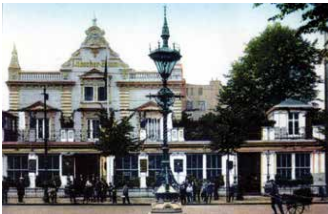
Abbildung 1: Außenansicht des Lübschen Baums.

Kurze Wintertage: Ein idealer Ausgangspunkt für einen mentalen Spaziergang bei einer Tasse Kaffee oder Tee. Lehnen Sie sich zurück und schlüpfen Sie in die Rolle von Margarete Pedersen, einer 23 jährigen Uhlenhorsterin aus dem Theresienstieg. Es ist der 16. September 1900, Sonnabendnachmittag um 16 Uhr. Margarete verlässt erschöpft, aber zufrieden das lichtdurchflutete Foyer des Tanzsaals „Lübscher Baum“. Hier hat sie bis eben beim Tanztee geklönt und ausgelassen getanzt.