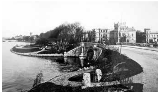
Abbildung 2: Blick vom Schwanenwik Richtung Uhlenhorst.

Sie setzt ihren Weg fort durch den kleinen Park mit den hohen Linden, der zwischen Buchtstraße und Löschteich liegt und durch den der Wind heute stetig rauscht. Ihr kommen zwei Männer entgegen, die jeweils