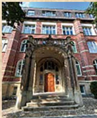
Abbildung: Verwaltungsgebäude des Waisenhauses 1908 (links) 1 und 2023 (rechts).

Was die Kinderbetreuung im Waisenhaus anbelangt, so war diese zunächst stark religiös geprägt. In den 1920er Jahren wurden staatliche und kirchliche Aufgaben durch Reformen der Weimarer Republik zwar säkularisiert, an der religiösen Erziehungsform im Waisenhaus änderte sich aber nur wenig. Einzig der Pastor war nun nicht mehr direkt der Hausleitung unterstellt.