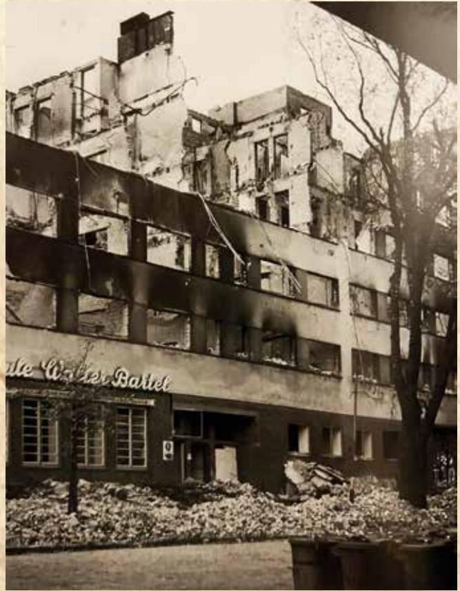
Ausgebranntes UFA-Haus mit Tanzschule. Hohenfelde und Uhlenhorst.

Doch eins konnte der schreckliche Krieg nicht nehmen: Den Lebensgeist und das Unternehmertum auf der Uhlenhorst und Hohenfelde. So widmen wir uns in der nächsten Ausgabe der Zeit des Neubeginns und Aufschwungs von 1945 bis 1970.