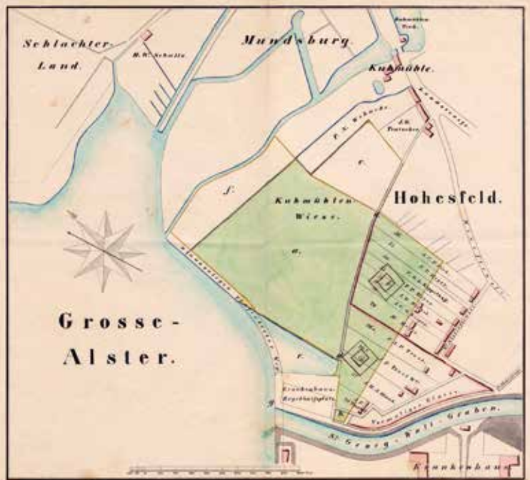
Hohenfelde, handkolorierte Lithographie (zw. 1840 und 1850). Lith. b. F. H. Nestler u. Melle.