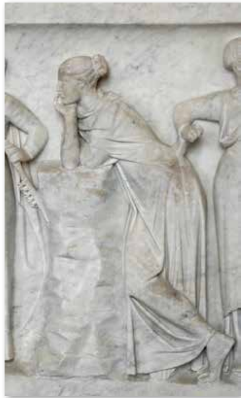
Polyhymnia, Muse der Hymnendichtung, Ausschnitt vom Sarkophag "Muses Sarcophagus". Dort sind neun Muses mit ihren Attributen abgebildet. Befindet sich im Louvre.