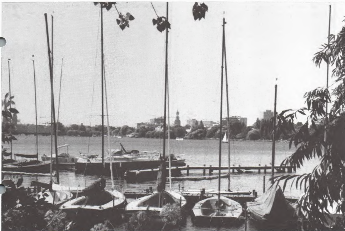
Ein Sommertag an der Außenalster