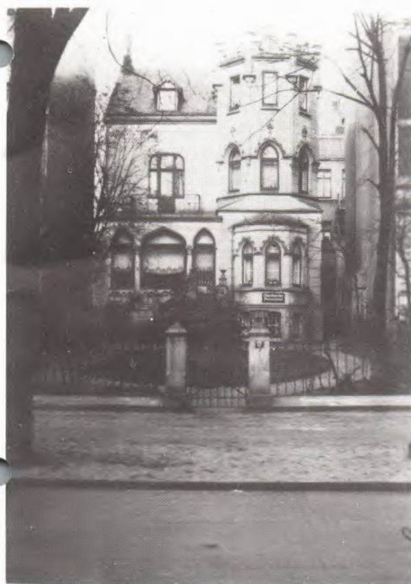
Damals Sitz des Uhlenhorster Bürgerverein