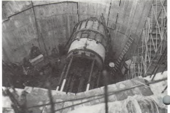
Ein Blick in den Schacht an der Lessingstraße: Das Rohr kommt aus dem Kuhmühlenteich heraus. Nach links (unsichtbar) geht es weiter zur Kuhmühle.

Herr Kirchner (vom Amt) kündigte an, daß die für 1987 termi- nierte Fertigstellung des Nebensammlers Kuhmühle deutlich zur Entlastung der Alster beitragen wird. Dazu gehört das Transportsiel nach Winterhude und Alsterdorf. Unterirdische Rückhaltebecken werden die Mischwasserüberläufe unter- stützen. Die erste Ausbaustufe des Systems wird ca. 280 Mil- lionen kosten. Von der Kuhmühle aus wird es unter die AVer- hoffstraße und den Winterhuder Weg bis zum Kreuz Herder- straße/Mozartstraße gehen. Hier muß der nächste Schacht ge- baut werden, von dem nach Süden und Norden hin vorgegan- gen wird. Dadurch verengt sich am Kreuz der Fahrverkehr. Alle Arbeiten sollen bis Ende 1989 fertiggestellt sein. Der Parkplatz Hebbelstraße wird als Materiallager eingerichtet.