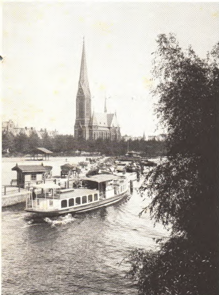
Kuhmühlenteich mit Anlegestelle der Alsterdampfer – 1905 – siehe auch Meckereien-Seite 8