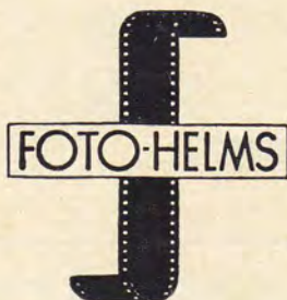
FOTO-HELMS führt Ihnen diese ideale Kamera gern einmal unverbindlich vor.

. . . macht wunderbare Bilder - ganz automatisch. Einfach, schnell und sicher wie noch nie. Durch den Sucher sehen und auslösen - so leicht ist das Fotografieren mit der dynamic , der Vollautomatischen mit den hervorstechenden Vorzügen. Übertreffende optische Ausstattung mit Voigtländer-Kristall-Leuchtrahmensucher und Lanthar 2,8 - stufenlose Belichtungsregelung mit doppelter Zeit-Anzeige - automatisch auch bei Filter-Benutzung - neuzeitliche, elegante Form.